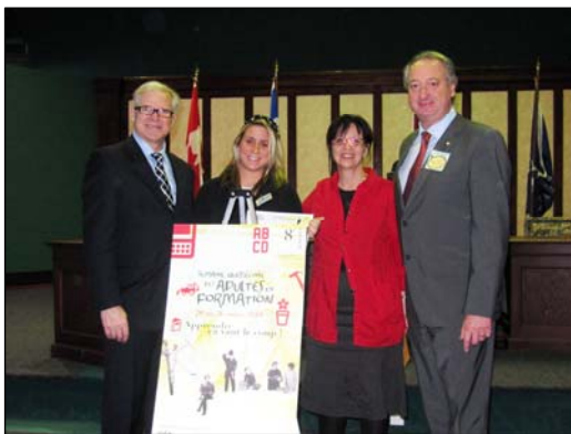
Une récipiendaire du Centre Jeanne-Sauvé, le maire et un conseiller de l'Arrondissement.

Comme par les années passées, une cérémonie honorifique pour la Fierté d'apprendre dans le cadre de la Semaine québécoise des adultes en formation a été organisée le 24 mars 2010 à la Mairie, en présence du maire et des conseillers d'Arrondissement. L'Arrondissement Lachine a une fois de plus défrayé les coûts du vin d'honneur et du buffet. Il y a eu près de 80 certificats remis cette année. L'organisation est bien rodée et la soirée s'est déroulée à merveille. Les jeunes adultes ont semblé ravis et fiers d'être présents. Un article dans le Messenger et dans l'Inform'Action sont parus à propos de l'événement.