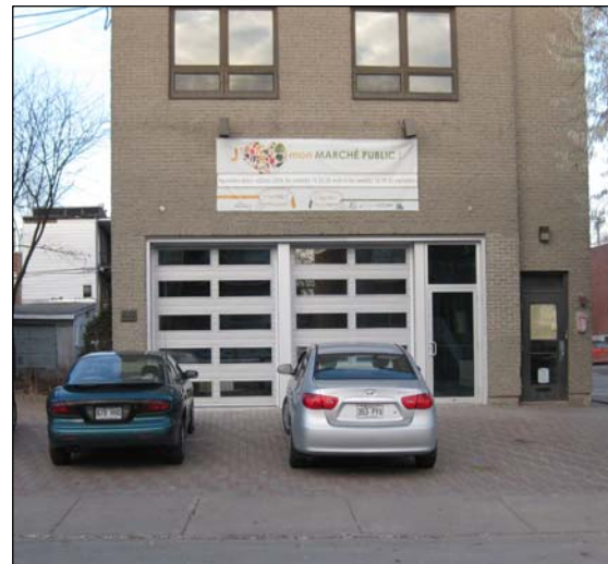
La fruiterie sera située dans l'ancienne caserne de pompier de Saint-Pierre

Piloté par le Comité de revitalisation urbaine intégrée du quartier Saint-Pierre (CRUISP), le Carrefour d'alimentation du quartier Saint-pierre est un projet qui a pris naissance il y a environ 4 ans. Ce dernier vise à réduire l'insécurité alimentaire dans un quartier aux prises avec un exode marqué de ses marchands. Il s'agit d'un projet en économie sociale visant à répondre, à distance de marche, à la demande en fruits et légumes frais des citoyens du quartier tout en leur offrant un lieu de rassemblement, de services et d'éducation populaire. On y retrouvera des cuisines collectives et communautaires et des ateliers d'éducation populaire favorisant les saines habitudes alimentaires. Le comité du Carrefour d'alimentation (formé d'élus, de représentants de la CDEC, du CLD, du Carrefour d'Entraide de Lachine, de l'Arrondissement, du CRUISP, de Concert'Action Lachine, ainsi que de citoyens du quartier) a travaillé tout au cours de l'année à mettre en œuvre ce projet novateur. L'ouverture du Carrefour d'alimentation prévu initialement pour l'automne 2009 a