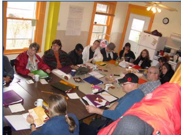
Citoyens et intervenants qui participent activement à l'élaboration de la programmation de la P'tite maison

Le dépôt d'une demande de financement au contrat de ville a été appuyé par le comité de lutte contre la pauvreté et obtenu pour 2009. Depuis, une accompagnatrice a été embauchée pour appuyer la coordination à la P'tite maison. Elle a eu comme mandat d'accompagner les citoyens participants dans leur processus décisionnel, d'assurer une présence qui a facilité la mise sur pied de nouveaux projets initiés par les citoyens et d'aider à la mobilisation citoyenne de la maison de quartier.