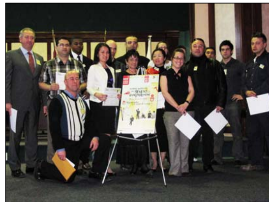
Les récipiendaires du CFP de Lachine accompagnés du maire.