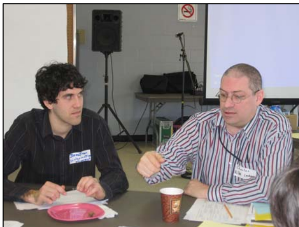
De belles discussions entre des acteurs communautaire et scolaire lors de l'Assemblée des partenaires du 18 février !

L'an dernier, nous avons terminé notre bilan 2008-2009 en écrivant que le conseil d'administration s'était dit en faveur d'assumer le rôle de liaison de la concertation dans la mesure où ses ressources humaines et financières le lui permettraient. Le 4 juin 2009 une dernière réunion appelée communément «grand messe» a réuni tous les acteurs du